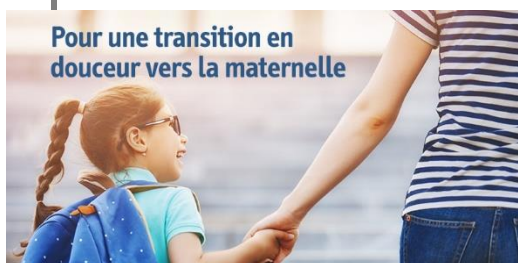
Pour une transition en douceur vers la maternelle

Voici les moyens que j'utilise pour favoriser la réussite éducative notamment en facilitant la transition scolaire de votre enfant :